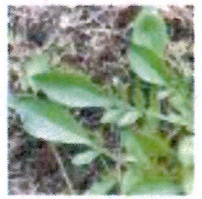
小葉に分かれた葉