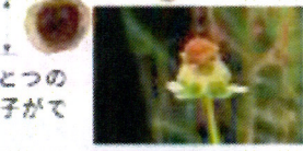
花が終わった後の頭状花