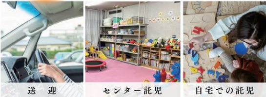
送迎 センター託児 自宅での託児

都城市ファミリー・サポート・センターでは、子どもの送迎や託児を担っていただく有償ボランティア「援助会員」を大募集しています。ぜひ援助会員養成講座(後期)を受講ください! TEL26-3810